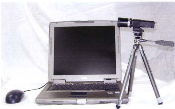
參考照片：外觀會依客戶需要而有所改變